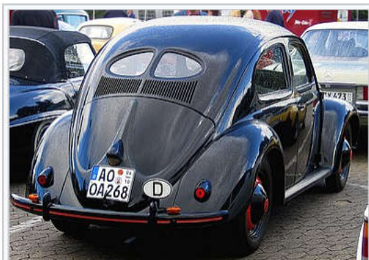
VW Standard uit 1951, in Nederland ook wel brilkever genoemd.