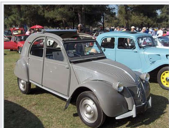
2CV uit 1955