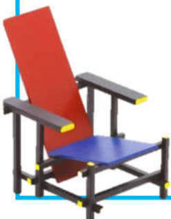
Foto van de stoel